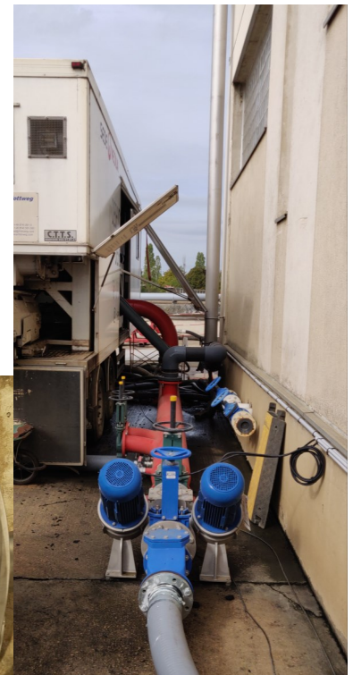
DIPBooster - Station d'épuration d'Achères